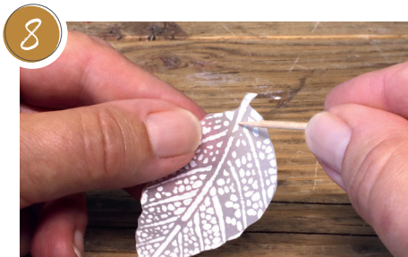
8 Ein Loch in das Transparentpapier stechen. Pierce a hole in the tracing paper.