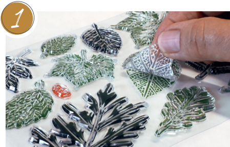
1 Silikonstempel von der Trägerfolie ziehen. Peel off the silicone stamp from the carrier foil.