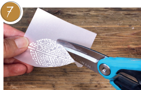
7 Gestempeltes Blatt ausschneiden. Cut out the stamped leaf.