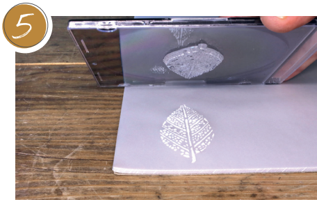
5 Stempel anheben. Lift the stamp.