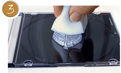
3 Mit dem Schwamm die 3D-Stempelfarbe aufnehmen. Den Schwamm auf eine Unterlage tupfen, damit sich die Farbe gleichmäßig im Schwamm verteilt, und den Stempel dünn betupfen. Pick up the 3D Stamp- and Paper paint with the sponge. Dab the sponge onto a surface so that the paint is evenly distributed in the sponge and dab the stamp thinly.