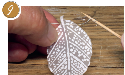
9 Vor jedes aufgefädelt Blatt den Draht um einen Zahnstocher o.Ä. wickeln. Das verhindert das Verrutschen. In front of each threaded leaf, wrap the wire around a toothpick or similar. This prevents slipping.