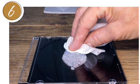
6 Den Stempel umgehend mit Wasser oder einem Feuchttuch reinigen. Immediately clean the stamp with water or a damp cloth.