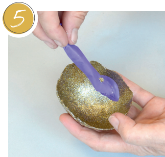
5 ... und entfernen. ... and remove. ... et les enlever.