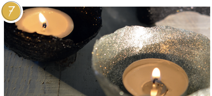
7 Kerzen nie unbeaufsichtigt brennen lassen! Never leave candles burning unattended! Ne laissez jamais une bougie allumée sans surveillance!