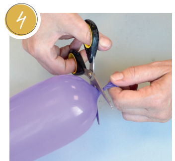
4 Ballon aufschneiden ... Cut balloon... Découper le ballon...