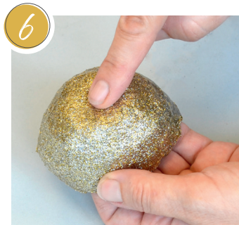
6 Standfläche formen. Form base. former des surfaces de pose.