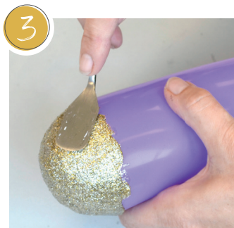
3 Zweite Schicht aufspachteln. Trocknen lassen. Plaster on the second layer. Allow to dry. Appliquer la seconde couche à la spatule. Laisser sécher.