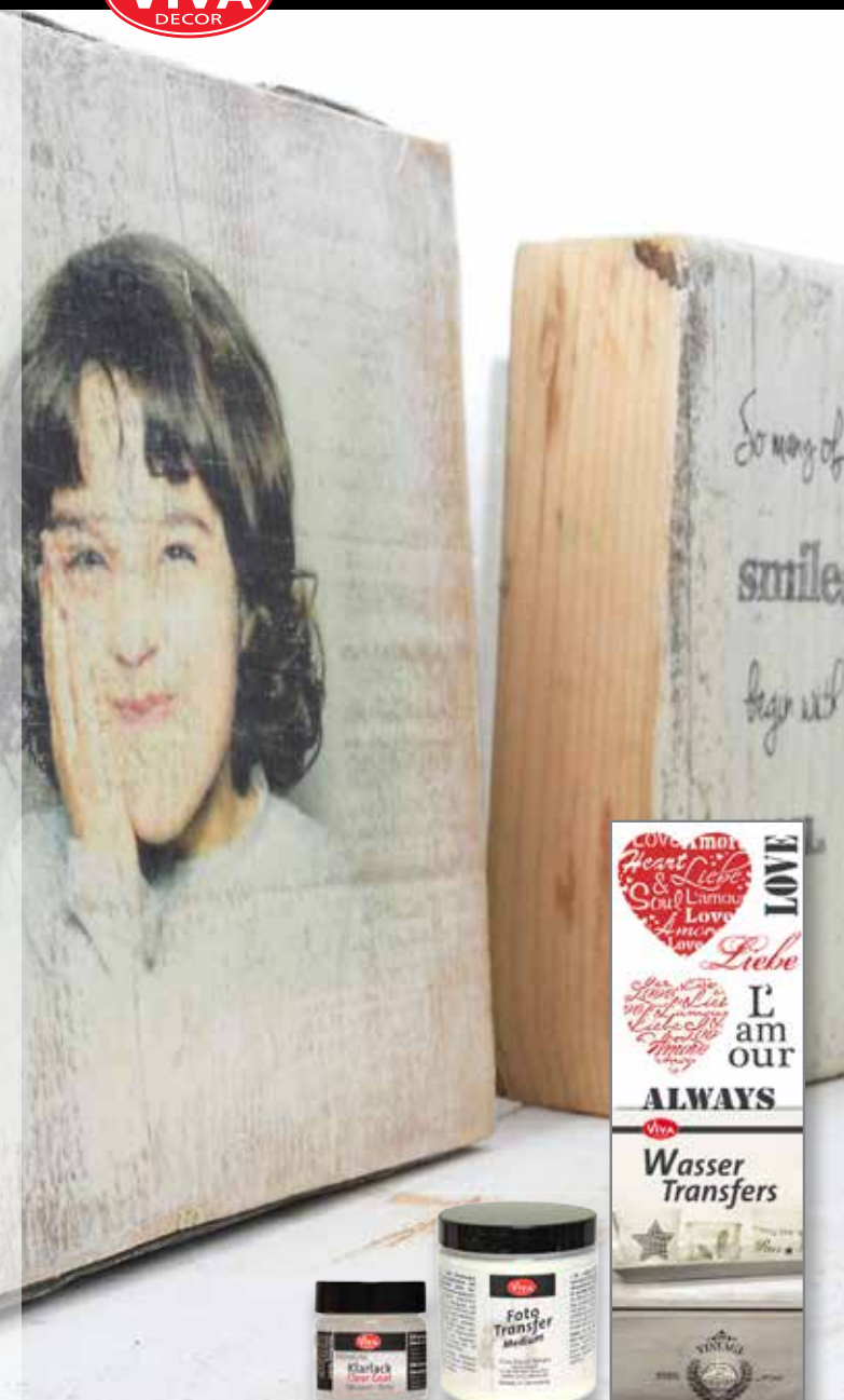
Foto-Transfer, ganz persönlich Photo transfer, customized Transfert de photos, complètement personnalisé Foto-Transfer del tutto personalizzato

Viva Decor GmbH Creative Color Company D-32108 Bad Salzuflen www.viva-decor.de