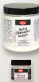
Foto-Transfer Medium: Laserausdrucke oder Laserkopien verwenden. Die gewählte Untergrund-Fläche und die Bildseite mit einem weichen Flachpinsel einstreichen und zügig aufeinander platzieren. Das Bild mit einem Raket o.ä. gleichmäßig andrücken. 24 Std. trocknen lassen oder 10 Min. trocken fönen. Papierschicht mit einem Schwamm befeuchten und die aufgeweichten Papierfasern wegreiben.

Nach dem Trocknen mit Viva-Decor Premium Klarlack überlackieren.