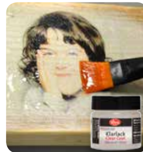
Foto Transfer Medium Photo transfer medium Transfert photo milieu Foto-Transfer legante