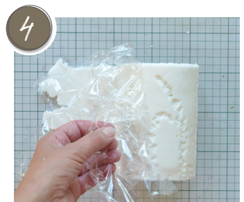
... und nach und nach weiter abziehen, während das Kamifleurstück um das Glas gelegt wird. ... and gradually continue to pull while the Kamifleur piece is placed around the glass.