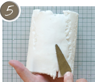
Kamifleur an das Glas andrücken und die Nahtstelle angleichen und glätten. Press Kamifleur against the glass and adjust and smooth the seam.