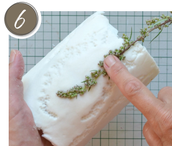
Sollte das Muster nicht ganz rundherum reichen, nochmals Gräser eindrücken und abziehen. If the pattern does not extend all the way around, press in the grasses again and peel them off.