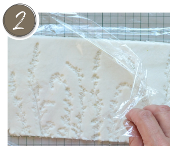
Die obere Frischhaltefolie komplett abziehen, und die Kanten mit einem Messer gerade schneiden. Completely peel off the top cling film and cut the edges straight with a knife.