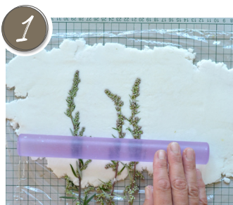
Kamifleur zwischen Frischhaltefolie ausrollen und Gräser unter Folie einprägen. Roll out Kamifleur between cling film and emboss the grass under the wrap.