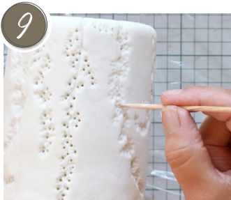
Mit einem Schaschlikstab / Zahnstocher Löcher stechen. Poke holes with a shish kebab stick / toothpick.