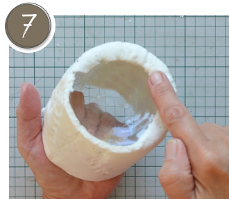
Die Ummantelung über die Bodenkante ziehen und glätten. Pull the covering over the bottom edge and smooth it out.