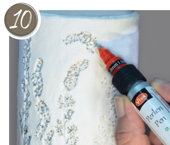
Nach dem Trocknen mit dem Perlenpen Akzente setzen. Malspitze verwenden. After drying, set accents with the Pearl Pen. Use a paint applicator.