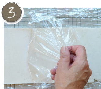
Die untere Frischhaltefolie ein wenig abziehen ... Peel off the lower cling film a little...