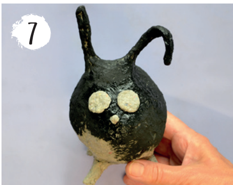
7 Angemalte Figur trocknen lassen.