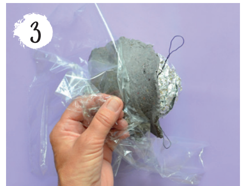
3 Das Pappmaché - mit der Folie nach oben - auf den Körper legen und die Folie abziehen.