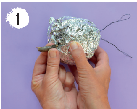
1 Aus Alufolie den Körper grob formen, ggf. Ohren/Beine/Schwanz mit Drähten/Stöcken bilden.