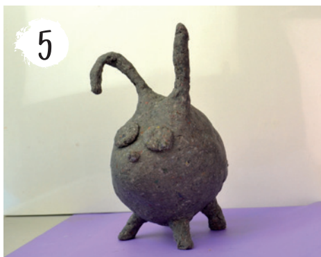
5 Fertige Figur trocknen lassen.