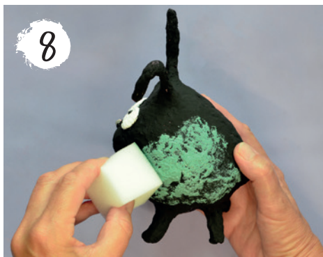
8 Die Kontrastfarbe Türkis dünn auftupfen, den Mund mit einem feinen Pinsel malen und die Feder aufkleben.