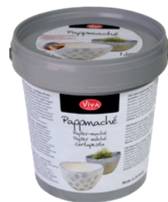
1290 801 98 Pappmaché 1.000 ml