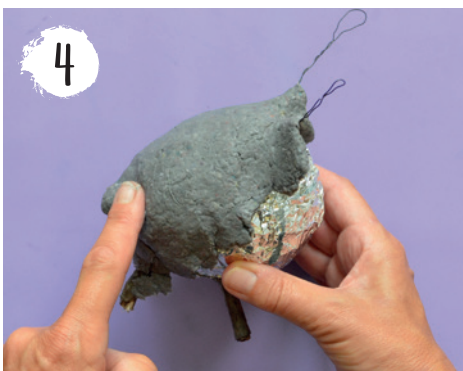
4 Jetzt die Form nachbilden. Augen und Details hinzufügen