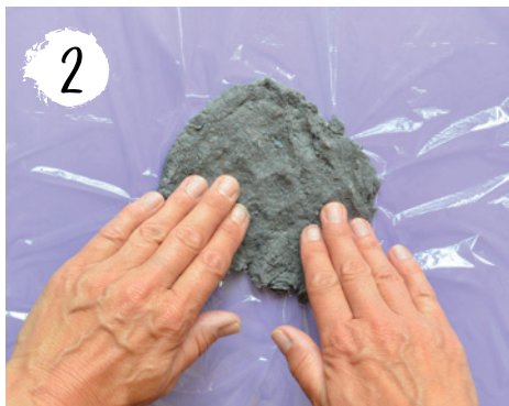
2 Pappmaché auf einem Stück Frischhaltefolie plattdrücken.