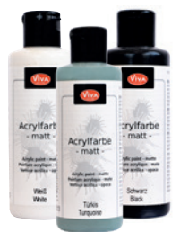
1259 100 13 Acrylfarbe 82 ml Schwarz, Weiß, Türkis