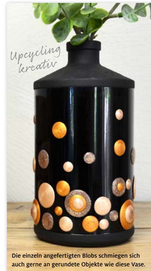
Die einzeln angefertigten Blobs schmiegen sich auch gerne an gerundete Objekte wie diese Vase.

Modelle, Fotos, Text: Viva Decor, Redaktion: creativetoday/C. Rückel